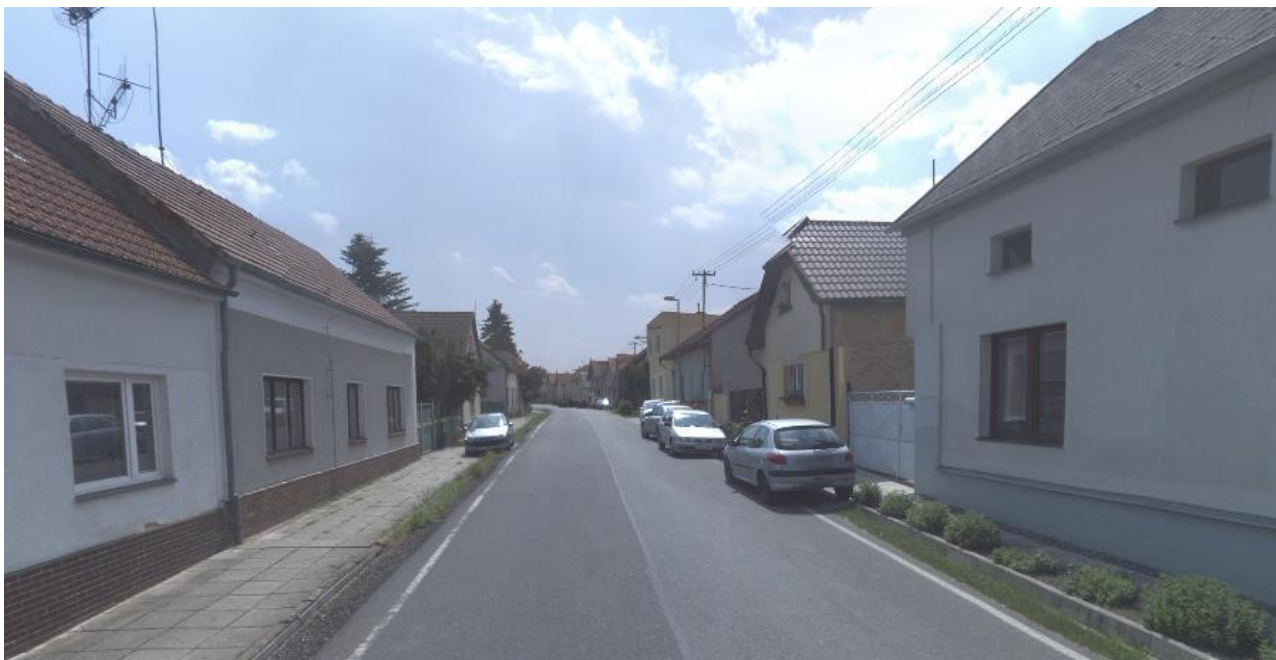
Chrast - stav (nevyhovující)