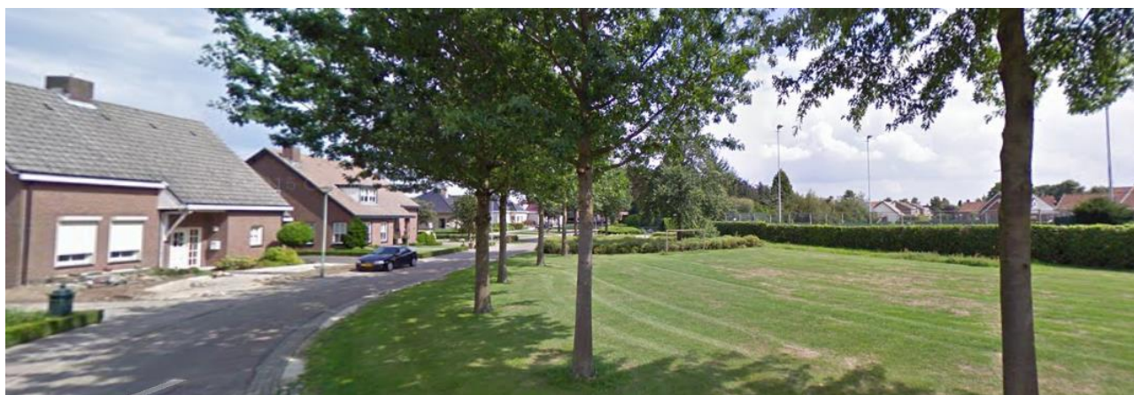
charakter veřejného prostranství v rámci zastavitelné plochy Z3

Profily komunikací jsou navrženy s ohledem na efektivitu veřejné správy a aktuální nároky a potřeby obyvatel území. Územní studie navrhuje minimální (vyhláškou požadované) šířkové parametry prostoru pro umístění obslužné komunikace (8, 10 m) zejména z důvodu snížení nároků na veřejný rozpočet a současně definuje nepřekročitelnou stavební čáru (6 m od hranice pozemku). Záměrem je vytvoření možnosti rozšířit veřejné prostranství o část soukromých pozemků na celkovou šířku 6+8(10)+6 m a umožnit alespoň lokální uvolnění veřejných prostranství nejen pro potřebu parkování, ale zejména pro potřebu založení kvalitních vegetačních pásů a stromových výsadeb. Kombinací těchto nástrojů je vytvořen předpoklad pro uvolnění stávajících nevyhovujících profilů veřejných prostranství, zahlcených odstavenými vozidly rezidentů. Parkování je řešeno na soukromých pozemcích, které mohou (ale nemusí) být součástí veřejného prostranství.