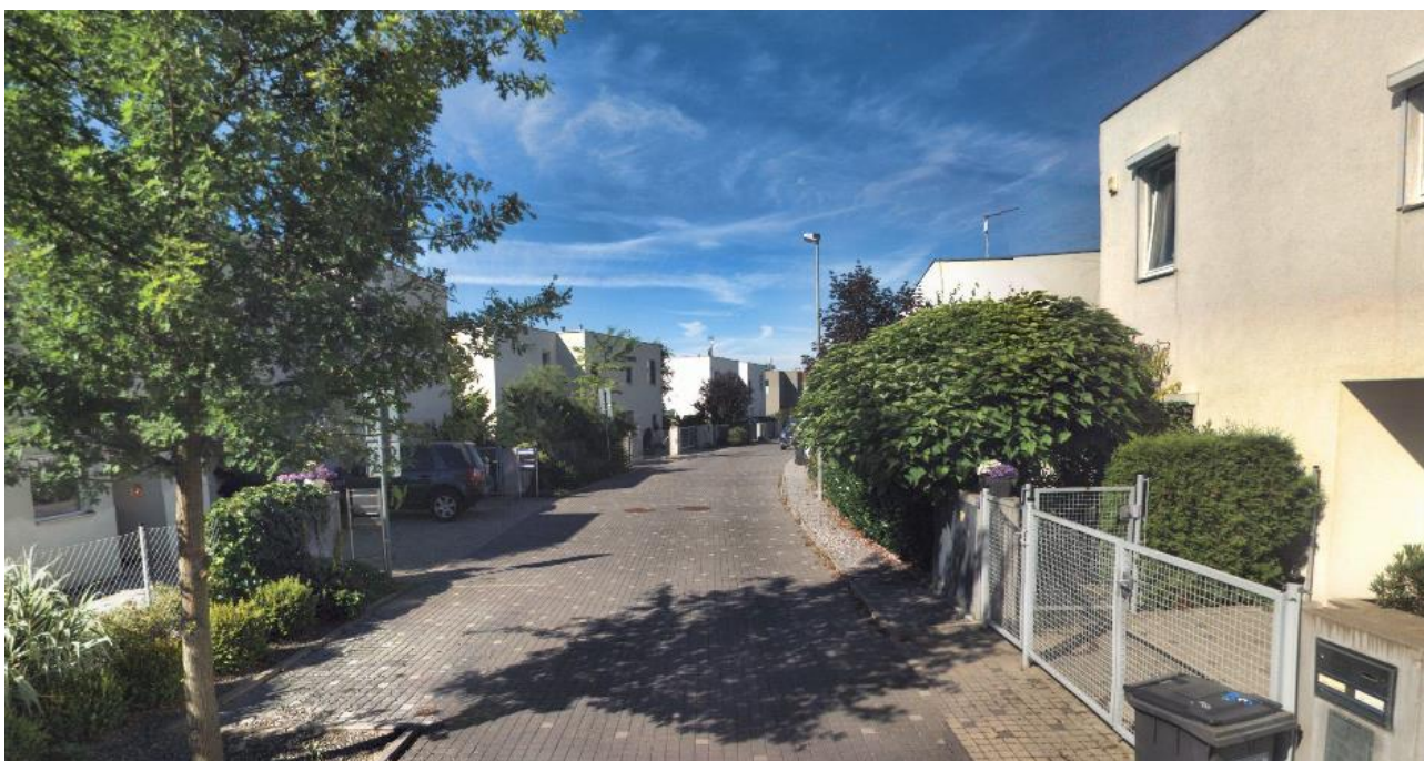
příklad možného uspořádání obslužné komunikace a veřejného prostranství