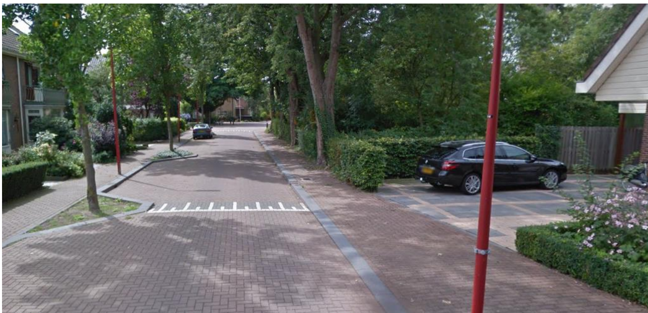
příklad možného uspořádání obslužné komunikace a veřejného prostoru